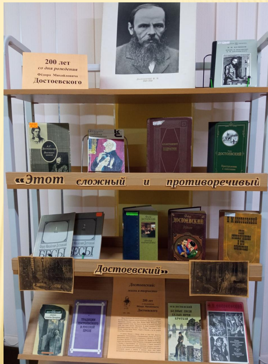
Фото выставки в читальном зале библиотеки.